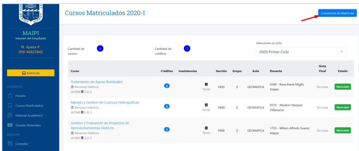
Figura 14. Constancia de Matricula desde Maipi.