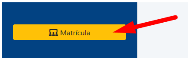
Figura 9. Botón Matricula.