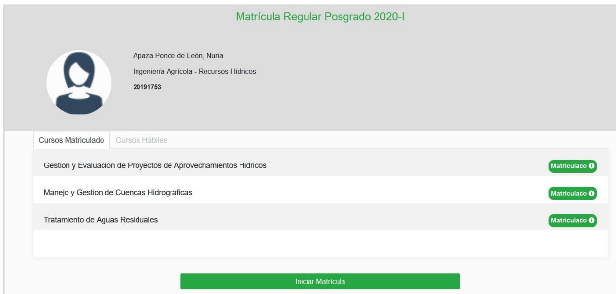
Figura 13. Lista de curso Matriculados.