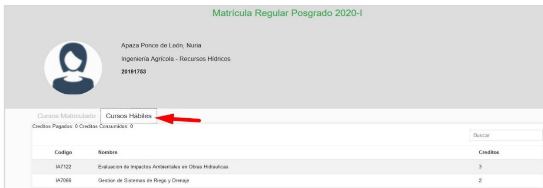
Figura 10. Pestaña de Cursos Hábiles..